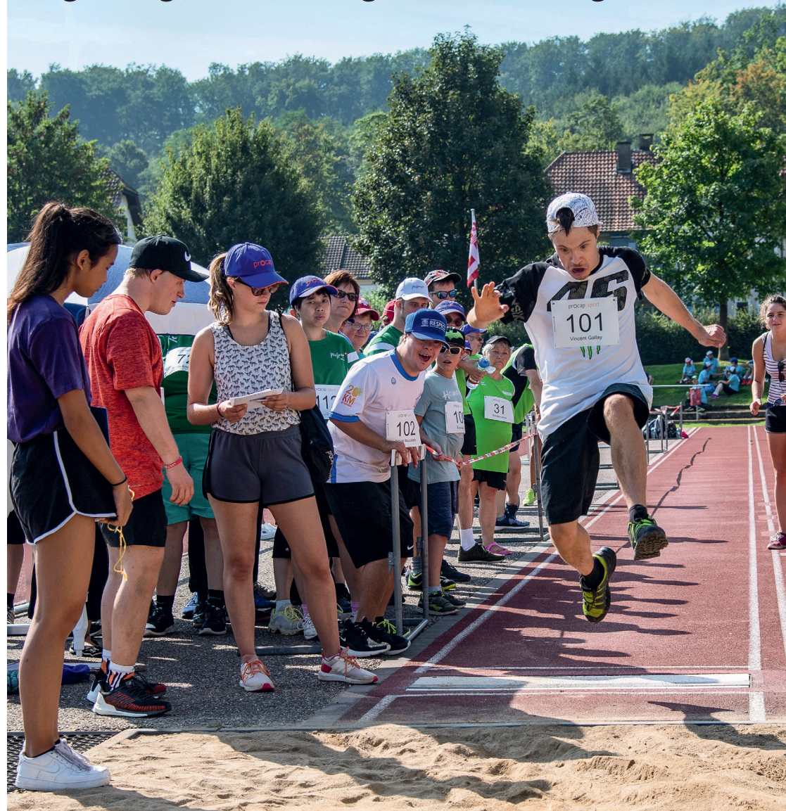
Bewegungs- und Begegnungstage 2019, Olten

Wir nehmen Inklusion ernst: Bei Procap engagieren sich Menschen mit und ohne Behinderungen – gleichgestellt und gleichberechtigt.