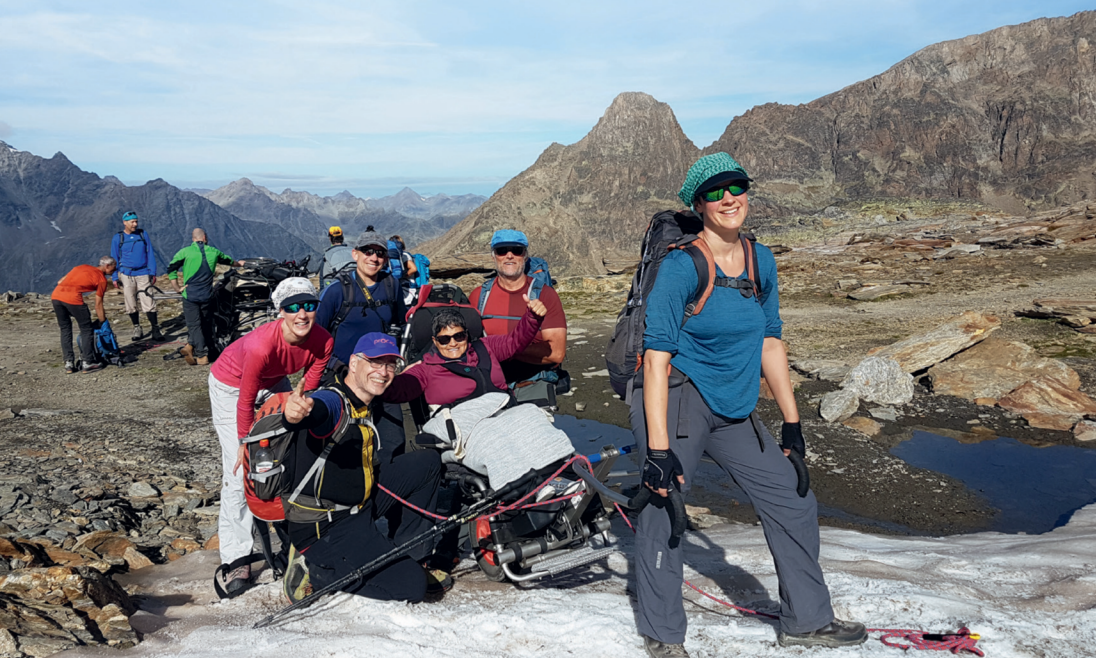
Mit dem «Protrek»-Rollstuhl zur Weissmieshütte SAC (VS).

Procap finanziert ihre Dienstleistungen durch Mitgliederbeiträge und Finanzhilfen der öffentlichen Hand. Aber Procap ist auch auf Spenden angewiesen. Sie können als Spender*in Zahlungen tätigen oder eine Spendensammlung organisieren.